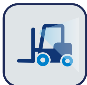
カメラからの映像入力